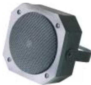
CP - 550 B

カラ - カメラ内蔵 スピ - カ出力は1W スピ - カはマイクと して使用可能です。